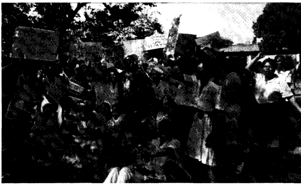
Le gouvernement a licencié 60 000 infirmières après leur grève sauvage de septembre 1995, dans laquelle les grévistes portaient des panneaux sur lesquels on pouvait lire: «Mandela Dehors!» Ci-dessous: les cliniques manquent désespérément de personnel et de moyens financiers et sont incapables de fournir des soins décentes aux masses noires.

Notre voyage nous a conduits des banlieues modernes au nord de Johannesburg, véritables forteresses où les Blancs vivent à l'écart, à Soweto, qui a été pendant des