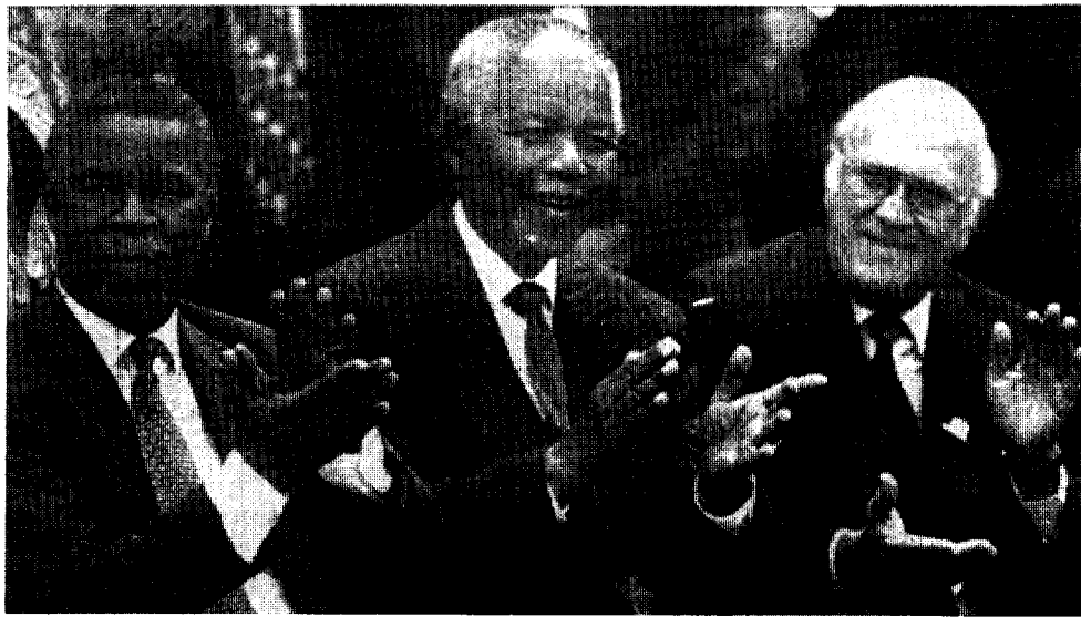
« Le partage du pouvoir » pour les dirigeants capitalistes racistes: Nelson Mandela (au centre), Thabo Mbeki – son successeur à la tête de l'ANC –, et l'ancien dirigeant de l'apartheid, F.W. De Klerk, applaudissent la nouvelle constitution, en 1996.

Le Population Registration Act [loi sur l'enregistrement de la population], le Group Areas Act [loi qui organisait la ségrégation de l'habitat] et de nombreuses autres lois avaient pour objectif la séparation complète des races: 90 % des Métis étaient confinés dans la province du Cap occidental, et 90 % des Indiens dans le Natal, à l'est du pays. Toutes les zones