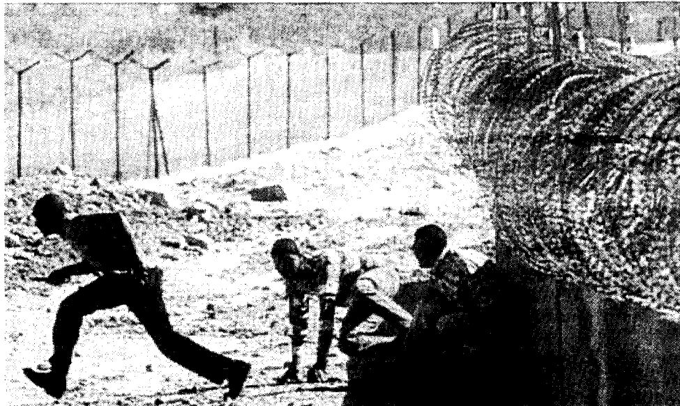
Des Mozambicains tentent de traverser la frontière vers l'Afrique du Sud. Le gouvernement dirigé par l'ANC organise les expulsions des travailleurs immigrés et des réfugiés.

La mise en place d'un gouvernement dominé par l'ANC en 1994 était aussi directement liée à la contre-révolution capitaliste en Europe de l'Est et en Union soviétique qui avait eu lieu quelques années plus tôt. L'Union soviétique avait