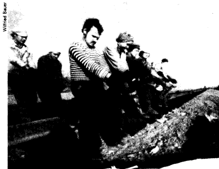
Jeunes volontaires soviétiques travaillant dans des conditions éreintantes sur un tronçon du Trans-Sibérien.