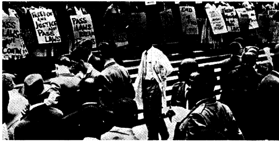
Les femmes ont joué un rôle héroïque dans la lutte anti-apartheid : ci-dessus, à Johannesburg en 1957, manifestations contre les lois sur le « pass ». En 1959, répression d'une manifestation de femmes par les flics de l'apartheid (ci-dessous).

Les lois sur le pass faisaient partie d'une législation de plus en plus draconienne sur les lieux de résidence, sur les restrictions aux déplacements et sur les exclusions des organisations syndicales, législation qui chassa les femmes des zones urbaines – et de leurs emplois. Pour beaucoup d'entre elles, tout ce qui restait dans les villes c'étaient les emplois de domestiques. Pourtant, les femmes noires conti-