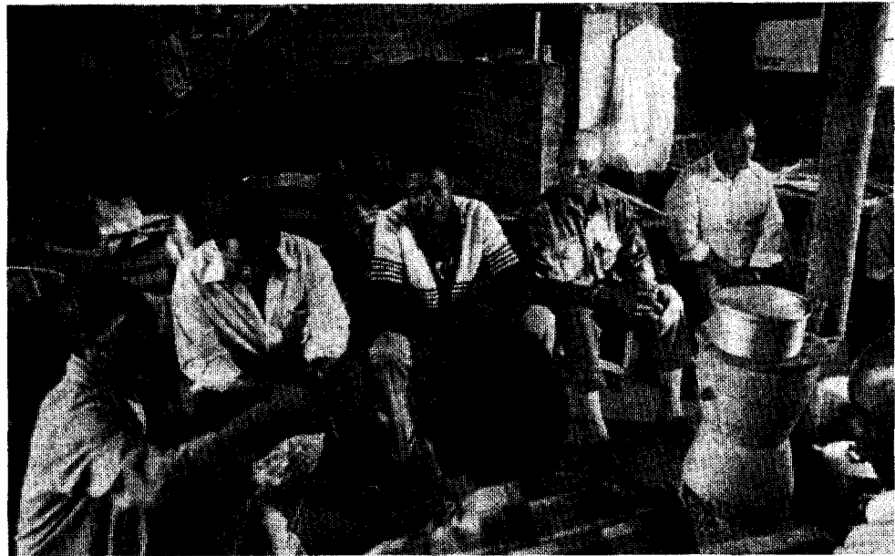
Dans les environs de Johannesburg, des travailleurs immigrés zoulous sont obligés de vivre dans des casernements sordides, séparés de leurs familles.

Les hommes achètent leurs femmes – qui sont souvent encore des enfants – en payant traditionnellement avec du bétail et aujourd'hui le plus souvent en argent liquide. Quand la femme met au monde des enfants, ceux-ci deviennent également la propriété de l'homme ; et la femme perd donc ses enfants si elle le quitte. Ce sys-