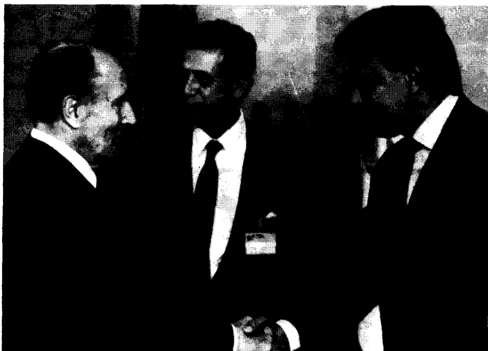
Avec Felipe González, le premier gouvernement de « gauche » depuis la Guerre civile a été élu en 1983. Il collabora immédiatement avec Mitterrand pour écraser les séparatistes basques.

que Trotsky comparait la France à l'Espagne : « Le retard du développement économique de l'Espagne a inévitablement affaibli les tendances centralistes inhérentes au capitalisme. Le déclin de la vie commerciale et industrielle des villes et des liaisons économiques entre elles a atténué la dépendance réciproque de certaines provinces. Telle est la cause principale qui n'a pas permis jusqu'à ce jour à l'Espagne bourgeoise de vaincre les tendances centrifuges de ses provinces historiques. La pauvreté des ressources nationales et le sentiment de malaise régnant dans toutes les parties du pays ne pouvaient que nourrir les tendances séparatistes. Le particularisme se manifeste en Espagne avec une force spécifique, surtout par comparaison avec sa voisine, la France, où la Grande Révolution a affermi définitivement la domination de la nation bourgeoise, une et indivisible, sur les vieilles provinces féodales » (« La Révolution espagnole et les tâches communistes », 24 janvier 1931).