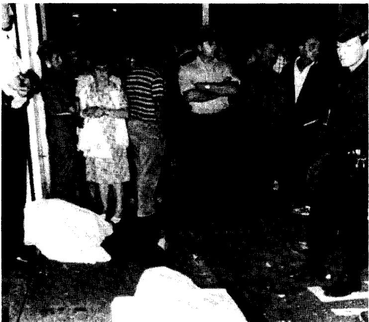
Bayonne, 25 septembre 1985: le GAL assassine 4 réfugiés. Le GAL, avec la complicité des services de l'Etat français, a fait 27 morts et 30 blessés parmi les réfugiés politiques et la population du Pays basque Nord de 1983 à 1987.

En France, les Basques n'ont aucun statut légal - il n'y a pas de département ni même d'université basques. Récemment, la suppression du droit d'asile, les expulsions sommaires de militants basques et les activités des terroristes fascistes du GAL ont servi à nourrir le ressentiment national y compris dans le Pays basque français, où il y a une grande solidarité avec les Basques de l'autre côté de la frontière. Même si le développement de la question basque