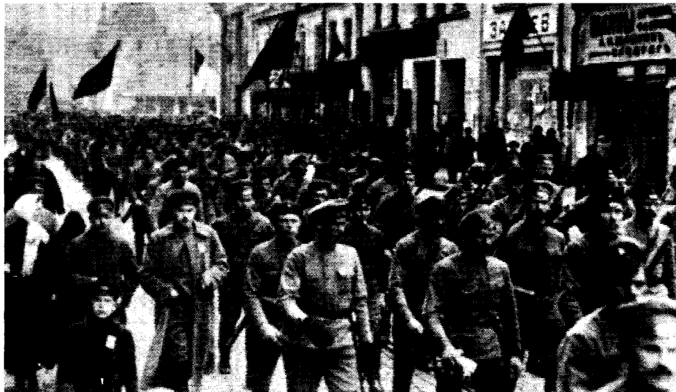
Les bataillons de tirailleurs lettons à Petrograd ont joué un rôle héroïque dans la Révolution bolchévique de 1917. Le soutien de Lénine au droit d'autodétermination de toutes les nations opprimées dans l'empire tsariste fut déterminante pour forger l'unité entre ouvriers russes et non russes.

bourgeoisies locales pour arracher des concessions au gouvernement central de Madrid. Mais l'oppression nationale, particulièrement des Basques, se poursuit sans répit. Au cours des 5 années entre 1990 et 1995, près de 2 000 événements politiques ont été réprimés, plus de mille personnes ont été blessées dans des heurts avec la police, y compris des gens qui ont été aveuglés par des balles en caoutchouc,