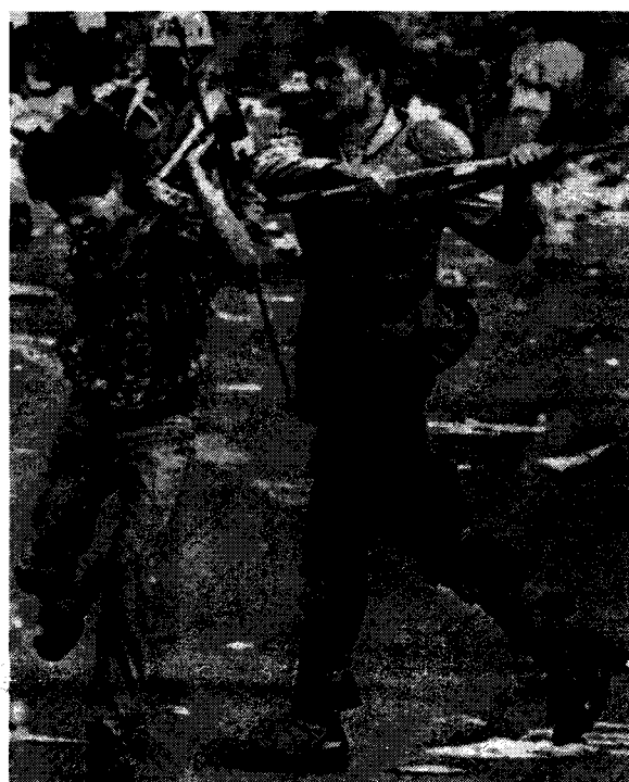
Manifestation des étudiants indonésiens contre le dictateur Suharto. Après le remplacement du dictateur par son sous-fifre Habibie, la dictature militaire reste en place. Seule la révolution ouvrière pourra balayer le régime capitaliste sanguinaire.

Après plus de trente ans de dictature militaire tyrannique, le règne de Suharto, l'homme fort d'Indonésie venu au pouvoir en 1965-1966 sur la base du massacre d'un demi-million d'ouvriers, de paysans, de communistes et de Chinois, s'est terminé. Après des mois d'inflation galopante et de chômage, dus à la crise économique qui fait rage en Asie du Sud-Est, la colère a explosé quand le gouvernement a, dans le cadre des mesures d'austérité dictées par le FMI, imposé des coupes sombres dans les subventions pour le combustible et autres produits de base nécessaires, ce qui a fait monter les prix de quelque 70 %.