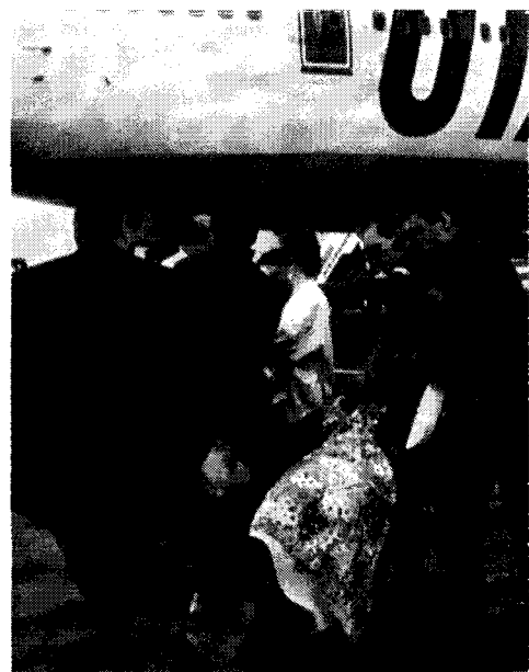
Orban - Sipa Press

LO veut faire croire qu'elle représente une opposition au front populaire de Jospin-Gayssot. Mais LO fait pression sur ce gouvernement qui matraque les chômeurs (à gauche) et expulse les immigrés. Cette politique pave la voie aux fascistes.